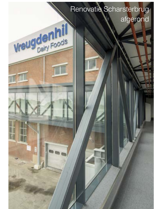
Renovatie Scharsterbrug afgerond

2 Afgelopen jaar is het K3-project afgerond voor de renovatie van de kantine, kantoor en kleedkamers. Deze zijn helemaal geüpgraded naar de huidige eisen. Zo zijn de kleedkamers opgesplitst in medium en high care ruimtes. "We kunnen daardoor meer klantsegmenten bedienen, die hogere eisen stellen aan de hygiëneomstandigheden."